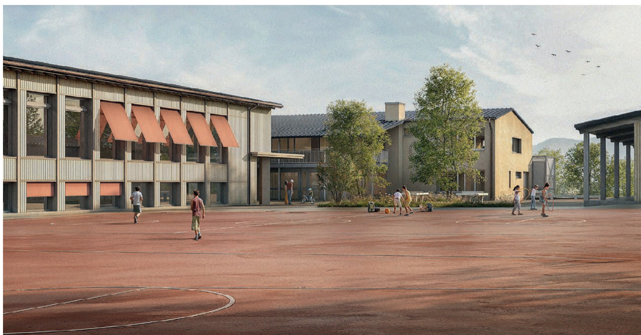
Visualisierung des neuen Schulhauses westlich des bestehenden Allwetterplatzes

Schulbehörde Primarschule Lommis www.schule-lommis.ch/downloads