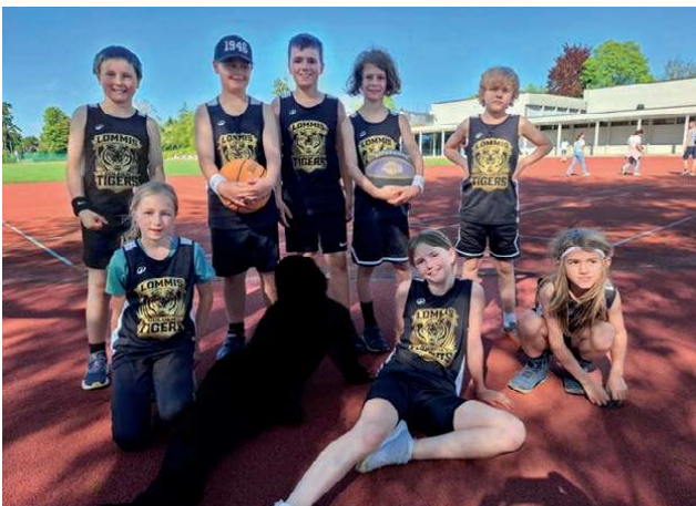
Team «Lommiser golden Tigers»

und so kam es dann am Nachmittag zum fünften und letzten Game. Verlassen haben wir die Meisterschaft mit der Silbermedaille, dem zweiten Rang 😊. Ich bin stolz auf das Fairplay und den Zusammenhalt meiner Lommiser golden Tigers! Wir haben gemeinsam gekämpft und ein grossartiges Resultat erzielt.