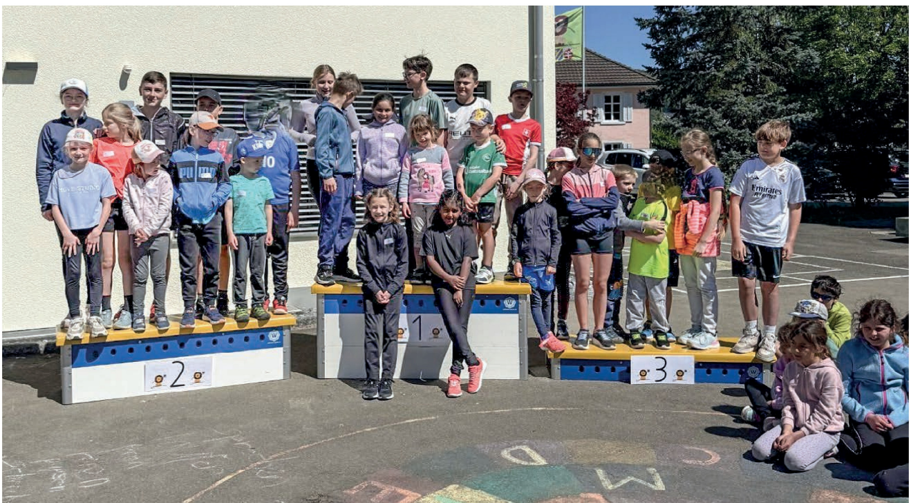
Kinder der Fahrzeuggruppen «Fahrrad», «Trotti» und «Flugzeug» standen auf dem Podest.