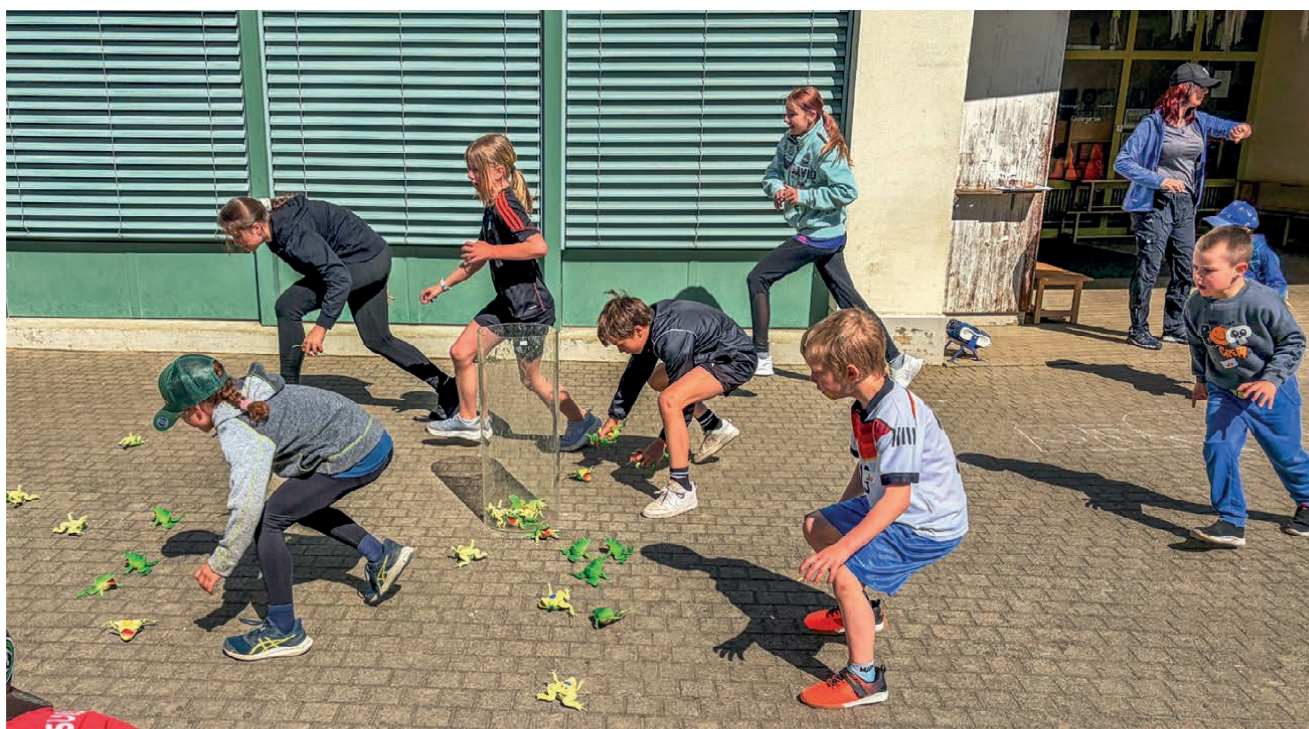
Froschwerfen in ein Aquarium