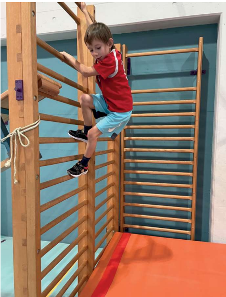
Über die Sprossenwand klettern

Am Dienstag, 28. November 2023 fand in der Turnhalle die Kick-off Veranstaltung zu unserem Jahresthema «Sport» statt. Wir stellten einen coolen Ninja Warrior Parcours auf und jede Klasse konnte sich darin sportlich austoben.