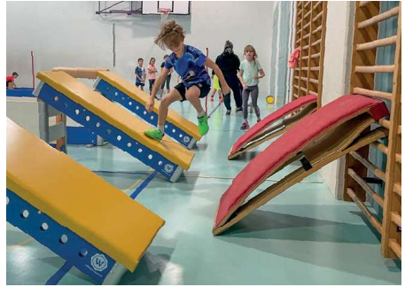
Ninja Warrior Parcours

Am Dienstag, 28. November 2023 fand in der Turnhalle die Kick-off Veranstaltung zu unserem Jahresthema «Sport» statt. Wir stellten einen coolen Ninja Warrior Parcours auf und jede Klasse konnte sich darin sportlich austoben.