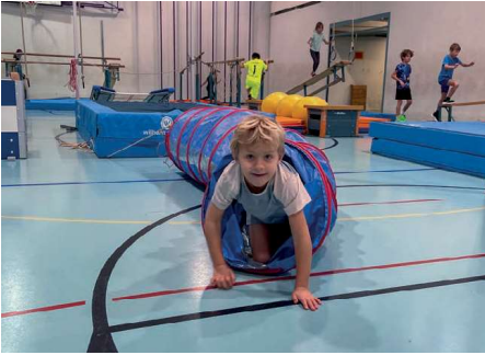
Start in das Jahresthema «Sport»